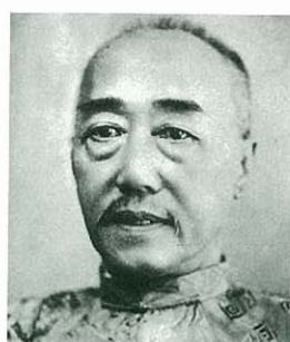
楊鶴齡，四大寇之一。