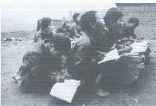
露天石頭當枱上課