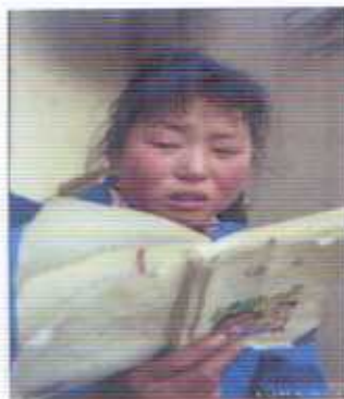
9 再艱苦也要讀好書